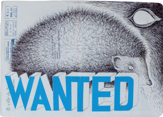
Série L'Œil, 2010, Stylo Bic et collage de plastique sur papier, 16 x 22 cm, Courtesy Semiose Galerie, Paris

François Coadou, Documents d'artistes Nouvelle-Aquitaine - www.dda-aquitaine.org, 2012