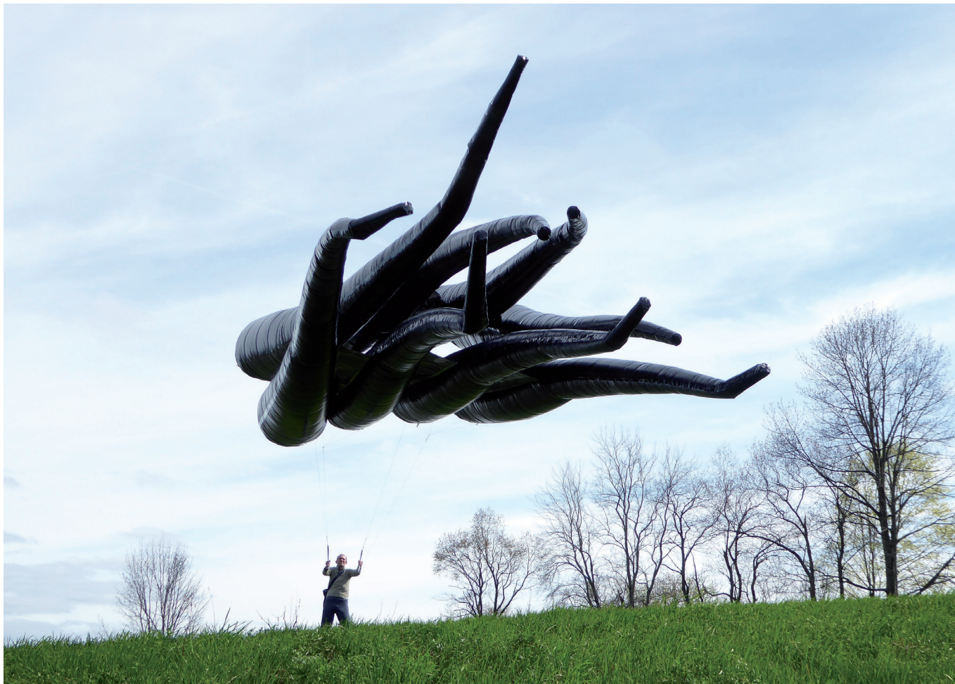
Forme n°5, 2017, Film mini DV, 2'50», Captations et montage : Agnès Aubague, Lieu de tournage : Hidley farm, Wynantskill NY/USA / La forme : Polyane, scotch, nylon / L 900 x D 100 cm x 8 éléments, Courtesy Semiose Galerie, Paris

Thomas Lanfranchi est né à Marseille le 15/08/1964. Il vit et travaille à Bayonne et Paris.