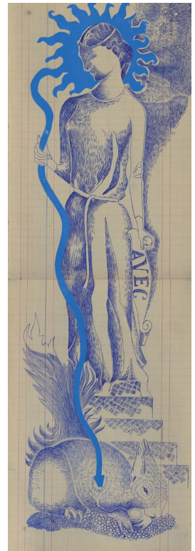
Sans titre, 2012-2015, Série de dessins au stylo Bic et collage sur papier, 58 x 20 cm