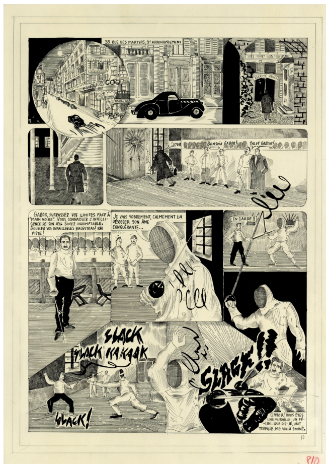
La Vie Souterraine, 2021. Extrait, p. 10, éditions Les Requins Marteaux © Camille Lavaud

Extrait d'un texte commandé par Documents d'artistes Nouvelle-Aquitaine