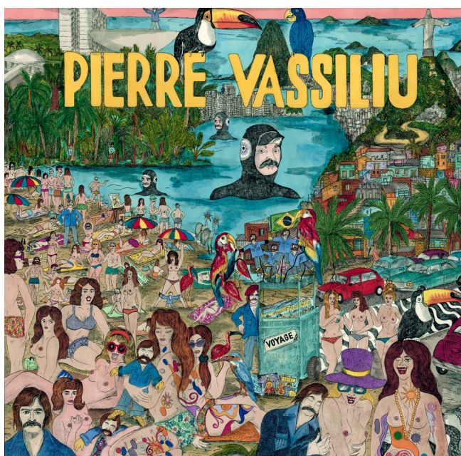
Pierre Vassiliu en voyage, 2019. Pochette de disque, Born Bad Records © Camille Lavaud