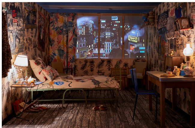
La Chambre de Jenny Dorr , 2018. Vue de l'installation à Lieu-Commun, Toulouse. Commissariat : Manuel Pomar.

L'Agence culturelle départementale Dordogne-Périgord et Documents d'artistes Nouvelle-Aquitaine proposent une édition consacrée à un artiste du fonds documentaire. Outil territorial de service public, l'Agence culturelle départementale Dordogne-Périgord a pour mission de favoriser la diffusion et la création artistiques, de valoriser la culture occitane, d'accompagner les acteurs de la vie culturelle et de sensibiliser les publics.