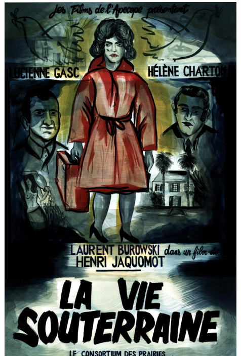
L'Oasis, 2018, Collection Fonds départemental d'art contemporain Dordogne (FDAC) et La vie souterraine, 2016. Série Le Consortium des Prairies © Camille Lavaud